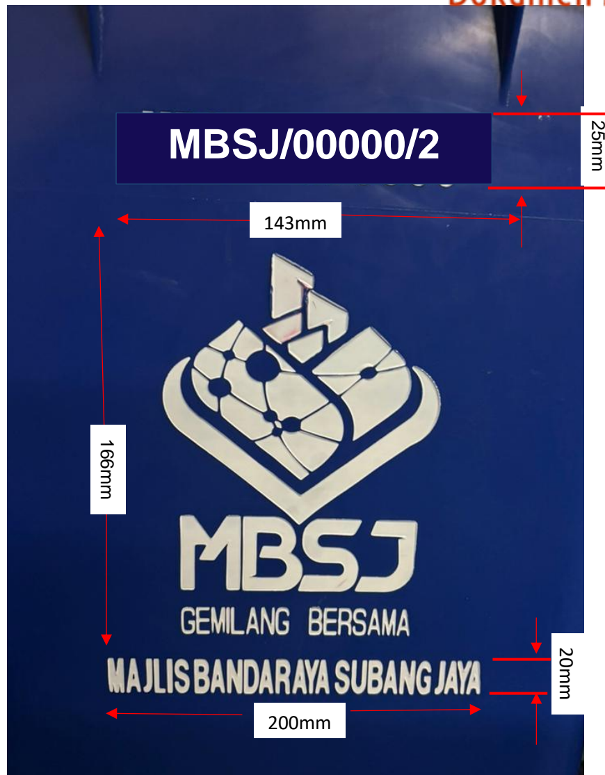
Gambarajah 3: Cadangan ukuran saiz dan logo Contoh gambar logo dan perkataan di tong sampah.