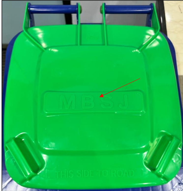
Gambarajah 2: Cetakan 'MBSJ' pada penutup tong sampah